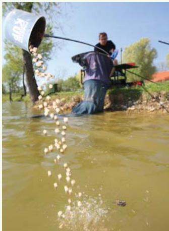
Ako želite ribu okupiti na malom prostoru, najbolje je dohranjivati Pole Cupom

Ovaj smo ribolov snimili na ribnjaku RD Markovci, koje djeluje kao ogranak RD Ptuj. Ribolov na ribnjaku je dozvoljen petkom, subotom i nedjeljom, a dnevna dozvola košta 8 eura. U slučaju da želite doći i ovdje loviti, raspitajte se o režimu i da li je jezero slobodno za ribolov, pošto se gotovo svaki vikend na njemu održavaju natjecanja. A koliko je ova voda bogata ribom, govori podatak da je uobičajena pobjednička težina za tri sata ribolova između 40 i 60 kila. Za sve informacije nazovite predsjednika društva, gosp. Zlatka Rajha, na tel. 00386(0)40 517 877.