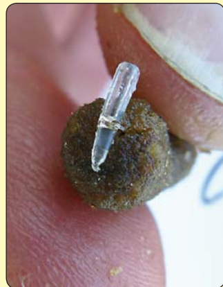
Sad izvucite iglu dok stoper ostaje, čuvajući da vam peleta ne padne u zabacu