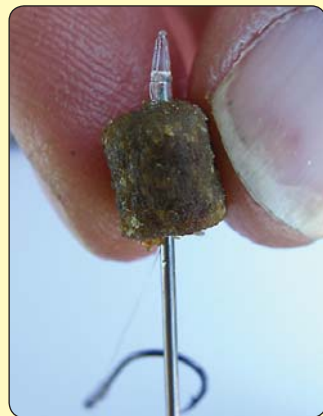
I zatim iglom probiti kroz sredinu pelete