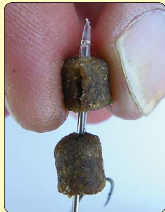
Možete dodati još jednu peletu