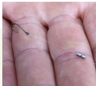
Kod ribolova na peletu zadnje olovce mora biti blizu udici kako bi se griz odmah primijetio